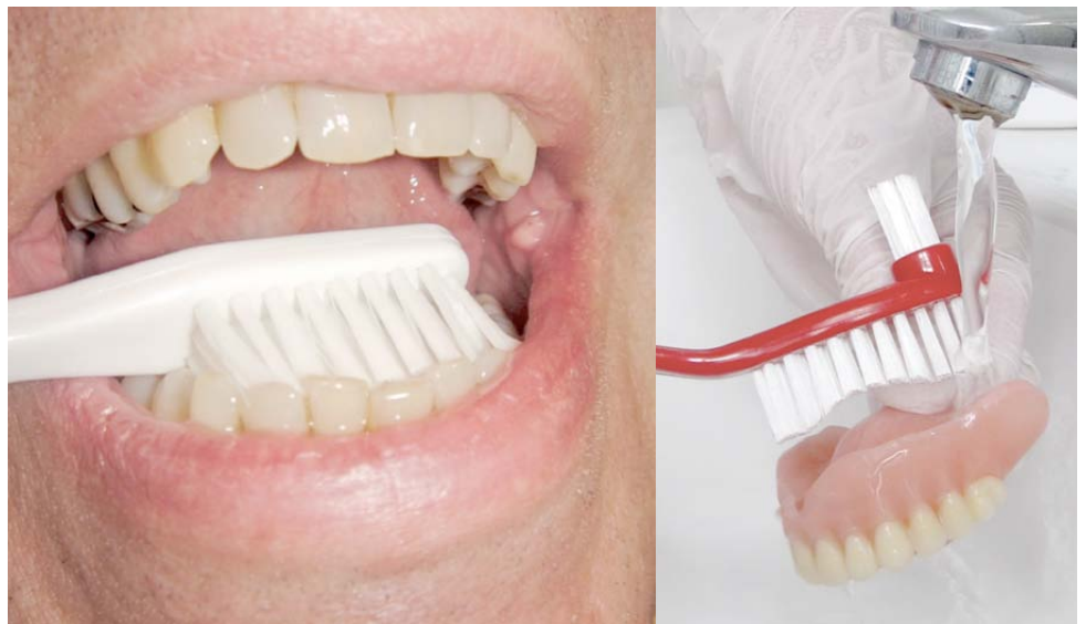
I Brovst børstes bedstes tænder.

Når protesen er ude om natten, kan den opbevares i et bæger med vand, der så skal have tilsat en desinficerende tablet. Ellers kan den rengjorte protese opbevares tørt om natten, fx i en proteseæske.