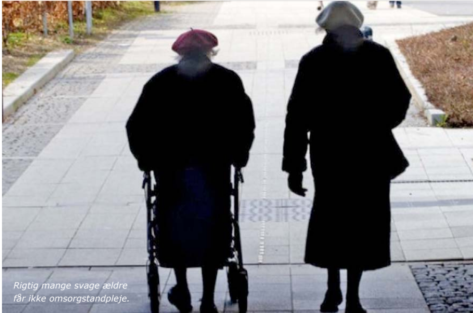
Rigtig mange svage ældre får ikke omsorgstandpleje.

Klik her, hvis du fremover ønsker at modtage nyhedsbrevet direkte på din egen e-mail adresse.