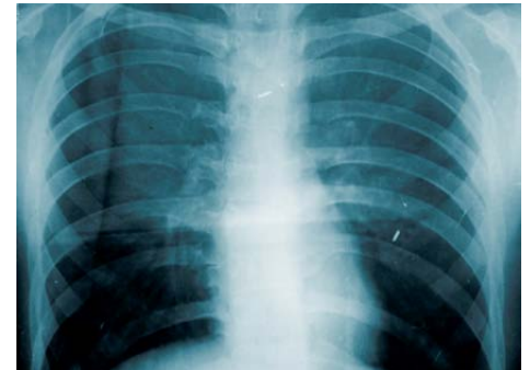
Fokus og handling virker.

Resultaterne fra undersøgelsen viste, at plejehjemsbeboerne fra gruppe 2 oplevede færre dage med feber, færre lungebetændelser, herunder lungebetændelser med dødeligt udfald. Endelig viste undersøgelsen en vis sammenhæng i mellem god mundhygiejne og beboernes daglige aktivitetsniveau samt "egen erkendelse".